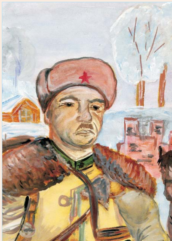
Портрет гвардии генерал-майора И.В. Панфилова.

Автор рисунка Юлия Першина, 13 лет, изостудия «Феникс», г. Белогорск, Амурская обл.