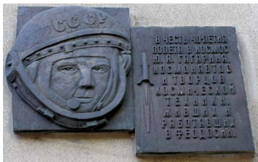
Мемориальная доска. г. Феодосия, гостиница «Астория»

Я закончил службу на подводных лодках в 1971 году и был направлен заместителем начальника 31-го научно-исследовательского центра Министерства обороны по науке и испытаниям в должности контр-адмирала. Командующий флотом всю