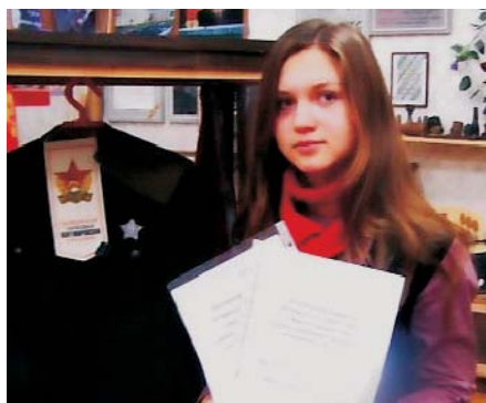
Автор работы в музее школы № 12

Я часто хожу мимо школы № 12, но не могу себе представить, что 68 лет назад, в августе сорок второго года, именно здесь, на школьном дво-