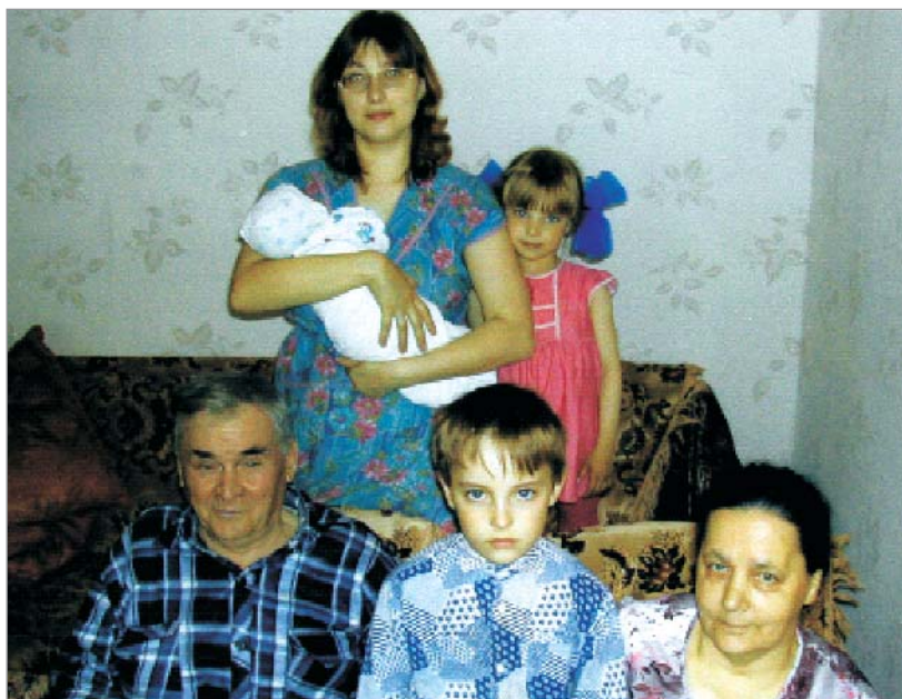
Наша дружная семья. Фото из семейного архива

В День Победы соберется вся наша семья, которой дедушка может гордиться.