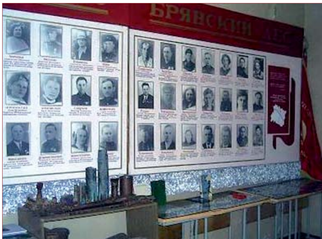
В школьном музее Дубровской средней школы № 1

получишь ли ты мое письмо. Если получишь, то пиши все и обо всем: кто жив, кто погиб. Мама, сейчас я не в авиации, я — танкист. Почему я стал танкистом, напишу позже. Мама, я уже не тот Саша, которого вы знали в 41 году. Военное звание мое — техник-лейтенант. Одним словом, офицер Красной Армии. Пока до свидания, целую вас... Передавай привет моим друзьям. Мама, обязательно напишите мне обо всем и обо всех. Мой адрес: полевая почта 32600. Целую. Саша».