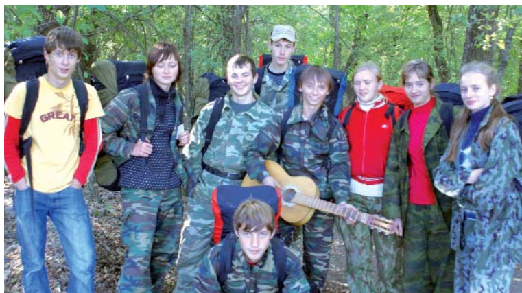
Во время маршрута

К концу маршрута в помятом и подмокшем от непогоды блокноте появились мои первые стихи о героике тех минувших дней.