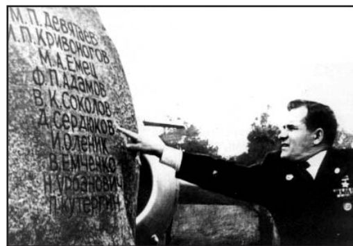
М. Девятаев у гранитного камня, установленного на о. Узедом. Германия. 1975 г.

15 августа 1957 г. вышел Указ Президиума Верховного Совета СССР о присвоении звания Героя Советского Союза Михаилу Петровичу Девятаеву за проявленные мужество, отвагу и героизм в борьбе с немецко-фашистскими захватчиками в годы Великой Отечественной войны.