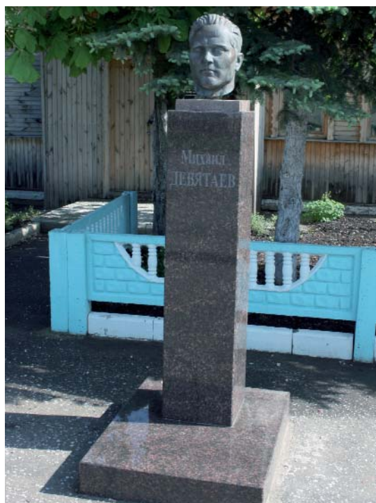
Бюст лётчика М.П. Девятаева. п. Торбеево, Мордовия

В мае 2008 г. моя мечта осуществилась. Ранним утром я был уже около музея, который находится среди обычных домов этого поселка. Скромный дом — перед ним установлен бюст героя, на доме мемори-