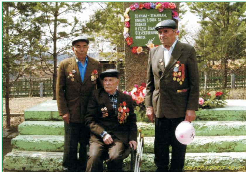
Мои знаменитые земляки.