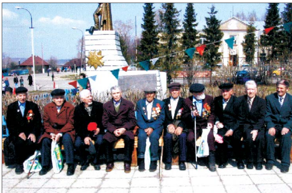
Ветераны нашего села.