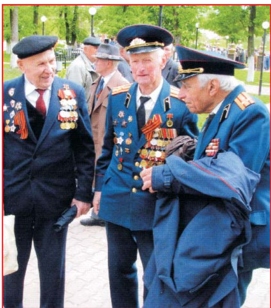
Когда встречаются друзья-однополчане.

Давным-давно закончилась война, Места сражений поросли лесами. Но вновь и вновь опять идешь ты в бой, Мой дедушка, бессонными ночами.